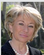
Catherine Dumas Sénatrice Conseillère de Paris

C'est le nouvel âge légal de la retraite, qui sera applicable, pour tous, à partir de 2018. Mesure phare de la réforme qui sera votée au Sénat à l'automne prochain, elle doit permettre de rétablir l'équilibre du régime par répartition. Ce relèvement sera progressif et débutera au 1 er juillet 2011.